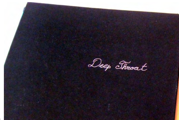
Garganta Profunda (25,5 cm X20,5 cm).

Seguiram-se os muito mais complicados Multiple Flag Books (Livros Múltiplas Bandeiras). Estes livros, ao abrirem, emitem um suave som estaladiço.