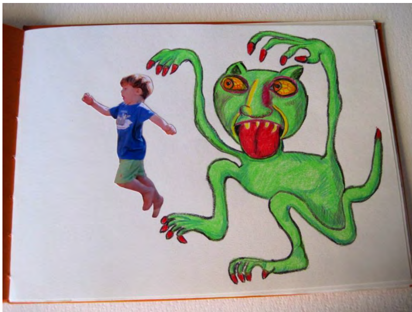
Fernando pulando das garras de um dos seus Monstros