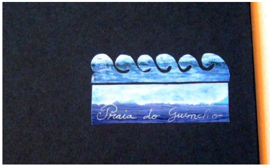
Praia do Guincho, (26 X 21 cm).